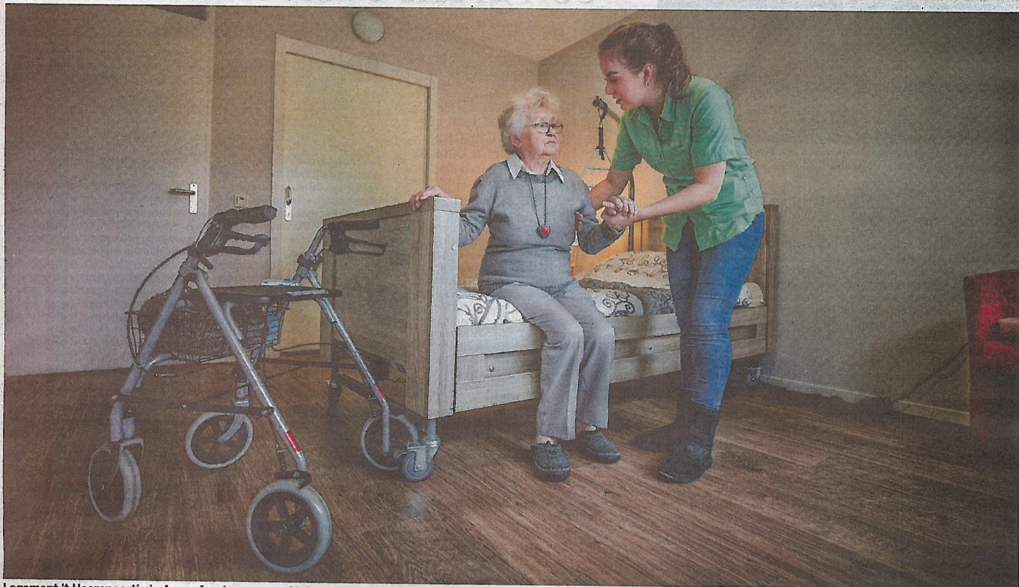
Logement 't Heerepoortje in Amersfoort, een zorgafdeling die gerund wordt door zeventien mbo-2-leerlingen.

Bijna een jaar na haar overlijden verschijnt de biografie over Adèle Bloemendaal, door Henk van Gelder.