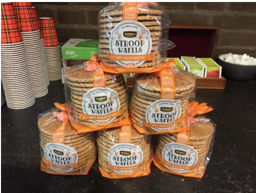
Kadootje van de Jumbo