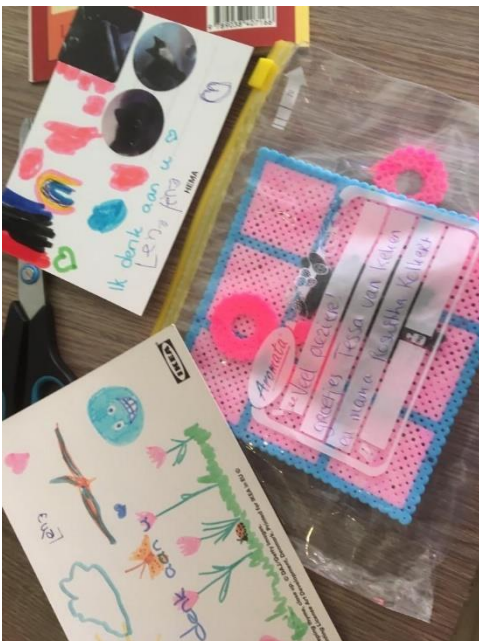
Kunstwerk gemaakt en aangeboden door familie